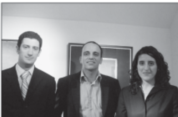
De Maltese kalligraaf d'Anastasio (midden) met zijn meekwaardig oeuvre te gast in de Brugse Galerie Art-O-Nivo. Links aan hem de cultureel attaché van Malta en rechts een lid van de Maltese ambassade.

Die drommen raken levend temidden die moete,